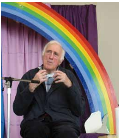
Jean Vanier

Compassie ziet er ook zo uit. Dit is Jean Vanier. Jean Vanier hielp de Arkgemeenschappen stichten, die je nu over de hele wereld vindt, gemeenschappen waarin het samenleven met mensen met mentale handicaps – meestal het Downsyndroom – centraal staat. De gemeenschappen die Jean Vanier stichtte, stralen tederheid