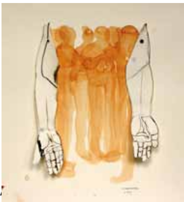
Ons zelf 2009 collage aquarel, o.i. inkt en splitpenntjes, 38 x 36 cm Caren van Herwaarden, www.cvanherwaarden.com