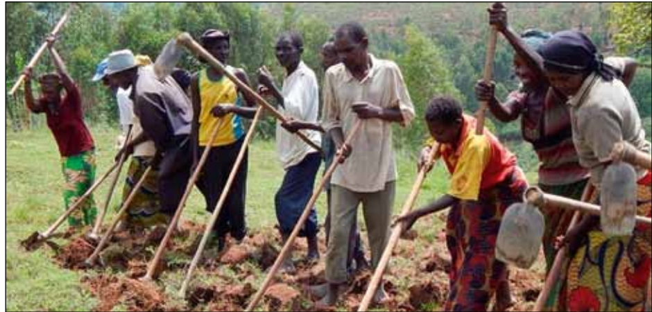
AMI brengt slachtoffers en daders samen, in 2013 in Nyaruguru

Om die broodnodige sociale cohesie in de dorpen te versterken heeft partnerorganisatie AMI, in 2000 opgericht door Laurien Ntezimana, een eigen visie en methodiek