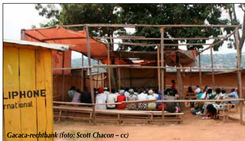
Gacaca-rechtbank