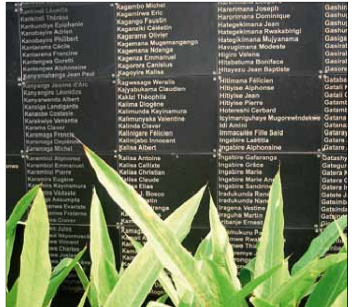
Genocide Memorial Centre in Gisozi, Kigali

waren voorts onrustwekkende uitingen van deze radicalisering. Die werd nog versneld en verhevigd door de moord op de Burundese president Melchior Ndadaye in oktober 1993. Deze laatste gold als het ware als de incarnatie van een geslaagd democratiseringsproces, maar werd drie maanden na zijn glansrijke verkiezing al vermoord door Tutsi's. De moord bracht een mokerslag toe aan het vredesproces in Rwanda, waar meer en meer burgers het vertrouwen in vrede, democratie en machtsdeling verloren. België drong erop aan om de Arusha-akkoorden met meer overtuiging uit te leggen als een noodzakelijk overgangscompromis. Een overgangscproces dat uiteindelijk zou moeten uitmonden in algemene democratische verkiezingen. Aan RPF-zijde werd echter weinig of geen animo bespeurd om eveneens vrije verkiezingen in het vooruitzicht te plaatsen.