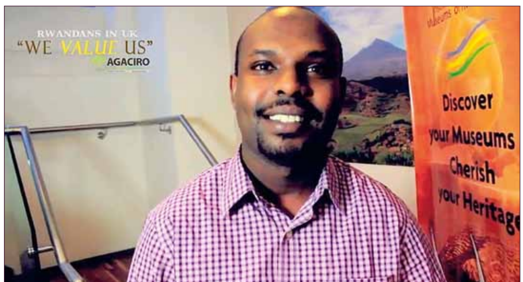
“We value us”: Agaciro-campagne voor Rwandezers in de UK

Meer nog is agaciro een concept dat voor niemand veel uitleg behoeft en deel uitmaakt van dagdagelijkse gesprekken. “Mensen zeggen geregeld ‘Dat is niet agaciro ’ om elkaar terecht te wijzen”, vertelt iemand me. “Het werd zo’n