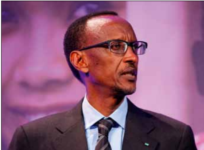
Paul Kagame

Het land heeft een totale gedaanteverwisseling ondergaan. Sociaal en economisch is Rwanda enorm vooruitgegaan. Op het vlak van onderwijs en gezondheid bijvoorbeeld zijn de resultaten spectaculair. Wat mensenrechten en democratie betreft, is er dan weer weinig veranderd. Vroeger was Rwanda een eenpartijstaat, en ook al doen ze hun best om dat wat op te smukken, in wezen is het dat nog.