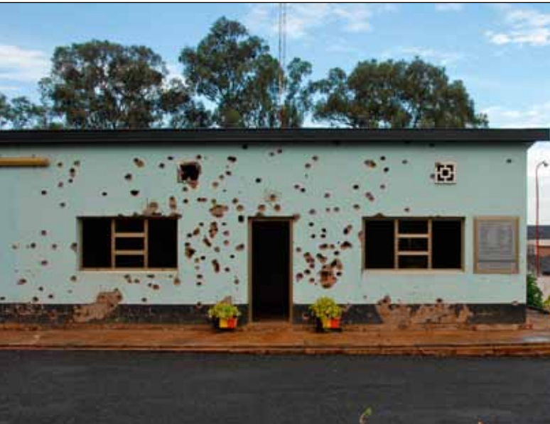
Memoriaal voor de vermoorde Belgische blauwhelmen in Kigali