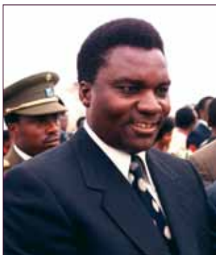
President Juvénal Habyarimana in 1980 in de VS

Zo werd het Habyarimana-regime geconfronteerd met twee grote uitdagingen: enerzijds dialoog en vrede bevorderen met het RPF dat in grote mate was samengesteld uit Tutsi-vluchtelingen die tijdens de ‘sociale (Hutu-)revolutie’ van 1959 hun heil in de buurlanden hadden gezocht, anderzijds moest ook het pad van het ‘aggiornamento politique’, van interne hervormingen worden ingeslagen: herziening van de grondwet, invoering van het meerpartijstelsel, bevordering van de persvrijheid, uitbouw van de rechtsstaat, bevordering van de mensenrechten en bestrijding van etnische discriminatie.