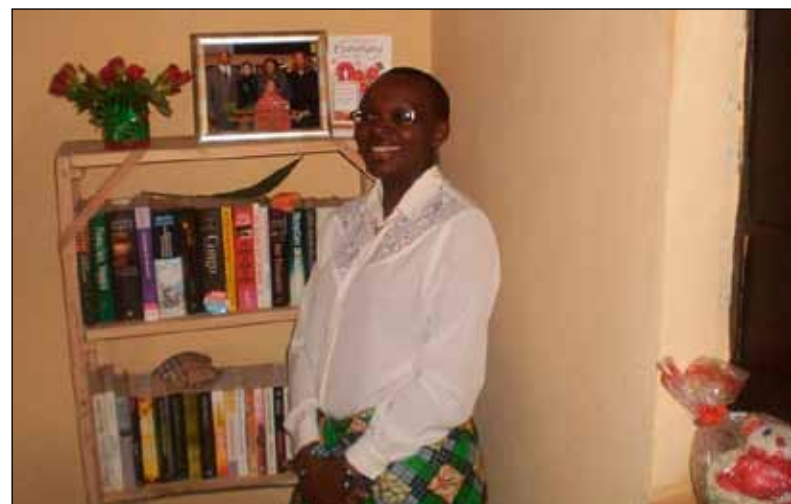
Victoire Ingabire 'viert' haar 25-jarig huwelijksjubileum in de cel (foto illegaal genomen in 2013, in Kigali)

Rwanda wordt door velen beschouwd als economisch wonder, flink op weg om het Singapore van Afrika te worden. Het sleutelwoord blijft echter uitsluiting. De macht wordt uitgeoefend door een kleine groep (van voornamelijk Tutsi's) die een monopolie heeft op de staat en zijn instrumenten. Een grote groep mensen, zowel Hutu's als Tutsi's, voelt zich politiek en economisch gemarginaliseerd en staat voor een justitie die de hare niet is.