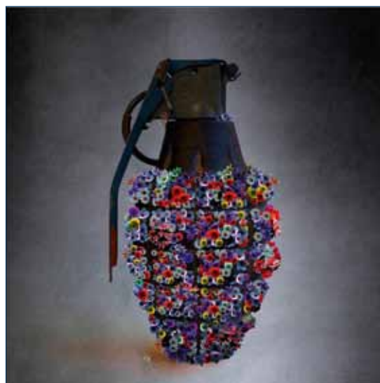
Vier "oorlogs" kunstwerken van Tamman Azzam, geboren in Damascus, nu verblijvend in Dubai (Ayyam Gallery)