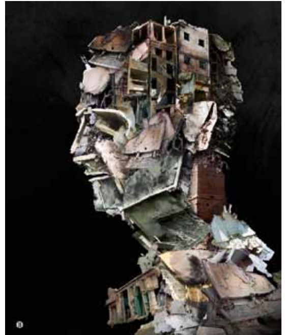
Bashir al-Assad (kunstwerk: Syrian Revolution Arts)

wapens vanuit Kroatië naar het VSL via Jordanië. Sindsdien zien onderzoekers regelmatig Joegoslavische wapens opduiken op Youtube filmpjes uit Syrië, terwijl die er tot dan nooit opgemerkt waren. Deze operatie zou met medeweten van de VS hebben plaatsgevonden, ook al onthoudt hun overheid zich van commentaar daaromtrent. 8 In april 2013 ging Jordanië akkoord om het doorgeefluik voor wapens voor het VSL te zijn. Voor deze beslissing ontving het 1 miljard dollar van Saoedi-Arabië. 9