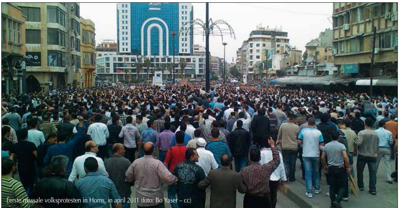
Eerste massale volksprotesten in Homs, in april 2011