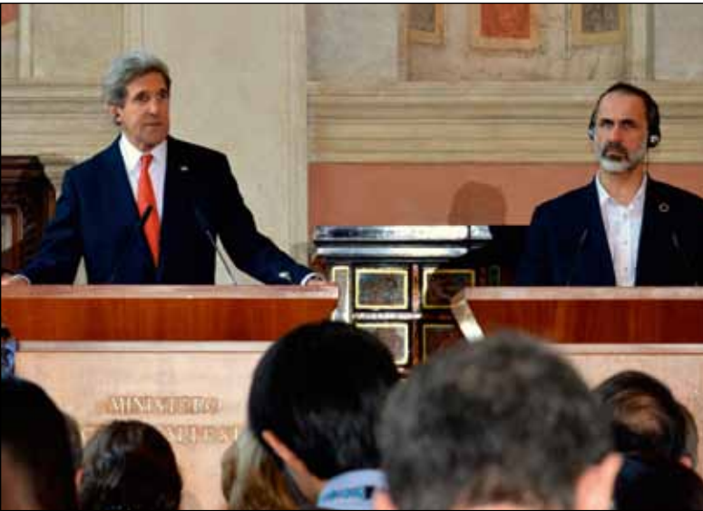
Mo'az al Khatib (rechts) in Rome, met Amerikaans minister van Buitenlandse Zaken John Kerry, in februari 2013

regimeleger om aan zijn zijde mee te vechten. Inspelend op de angst van alawieten en christenen, bestempelde het regime de oppositie als criminelen, extremisten en terroristen. De dreiging van een sektarische oorlog is één van de sleutelementen die het regime en zijn medestanders samenhoudt. Naast de religieuze breuklijn, buitte al-Assad ook de etnische diversiteit uit. De bevolking bestaat voor 80% uit Arabieren, 15% Koerden en 5% Assyriërs, Armeniërs en Circassiërs. De grootste kaap die de politieke oppositie moet rondren, is een perspectief bieden op co-existentie in het post-Assad-tijdperk, zodat de minderheden zeker zijn dat ze als gemeenschap kunnen blijven bestaan.