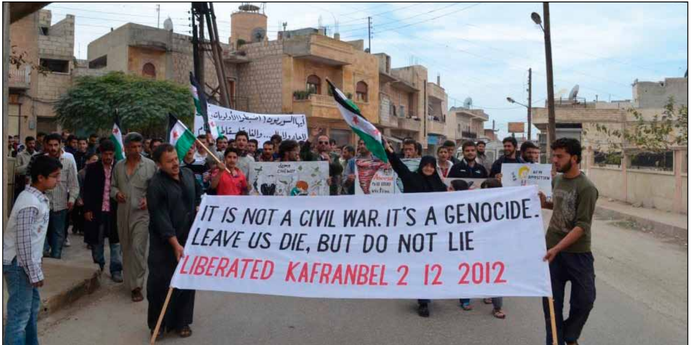
Eén van de vele protestdemonstraties met Engelstalige spandoeken in Kafranbel, Idlib

beschermen tegen de aanvallen van het regeringsleger. Maar na een tijd namen de rebellen een offensieve houding aan en vielen ze regeringsdoelwitten aan. Daarnaast namen veel aanvankelijk vreedzame demonstranten hun toevlucht tot wapens om zich te verdedigen tegen sluipschutters, veiligheidsdiensten en milities. Meer en meer jongeren kozen voor de gewapende strijd en sloten zich aan bij het Vrije Syrische Leger of andere nieuwe groepen zoals de radicaal islamistische milities.