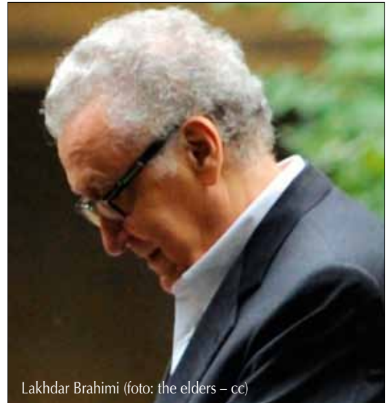
Lakhdar Brahimi

Zijn opvolger, Lakhdar Brahimi, deelt Annans analyses en recycleerde zijn vredesplan. In een vlammende briefing voor de leden van de Veiligheidsraad in januari 2013, hamerde Brahimi erop dat de verdeeldheid binnen de Veiligheidsraad, met name tussen Rusland en de Verenigde Staten, dringend moet stoppen. Die aanslepende verdeeldheid zorgt ervoor dat Brahimi geen duimbreed meer onderhandelingsruimte heeft dan Annan. Een essentiële sleutel tot vrede ligt in de Veiligheidsraad. Als er een consensus over een transitie komt tussen de permanente leden, kan de negatieve invloed van regionale actoren worden beteugeld. En dan komt er ruimte om in Syrië een klimaat te scheppen waarbij de strijdende partijen aan tafel kunnen gaan zitten. Dit is de analyse van Annan, gedeeld door veel diplomaten en internationale waarnemers. 3 Het uitgangspunt is dat de impasse waarin de internationale gemeenschap zich bevindt, het conflict onvermijdelijk versterkt. Dit klopt, maar de situatie is evenzeer complexer.