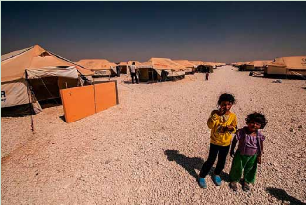
Syrische vluchtelingen uit Dara'a in het Zadari-vluchtelingenkamp in Jordanië

Ondanks de internationale inspanningen om het geweld te staken en de burgers te beschermen, escaleert het conflict verder. De bemoeienissen van derde landen gooien olie op het vuur en destabiliseren de regio. Buurlanden worden niet enkel geconfronteerd met enorme vluchtelingenstromen, maar raken meer en meer betrokken bij het conflict. Turkije kreeg al te maken met morteraanvallen en heeft Patriot-raketten van de NAVO geïnstalleerd; Jordanië heeft zijn luchtruim geopend voor drones; voor het eerst sinds 1973 waren er beschietingen op Israël vanuit de Golanhoogten en Libanon en zijn er spanningen ontstaan in Libanon en Irak.