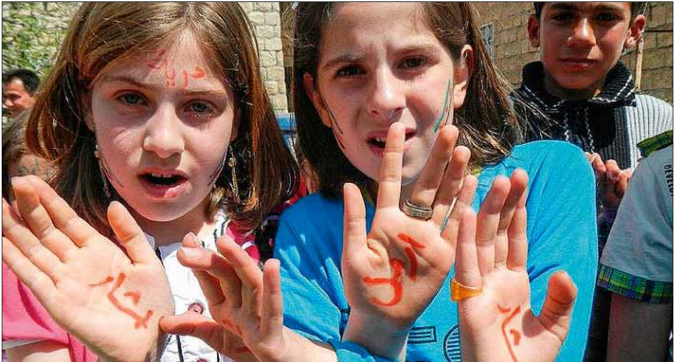
Protesterende kinderen tijdens één van de vele vreedzame anti-Assaddemonstraties in Kafranbel, Idlib