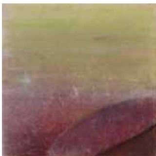
Coverillustratie: Toorn van Mikalojus Konstantinas Ciurlionis, 1904, Warschau