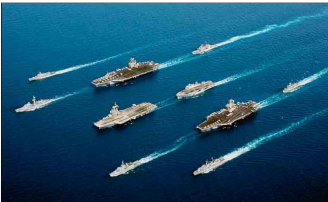
"Parade" van de Enduring Freedom -vloot in 2002