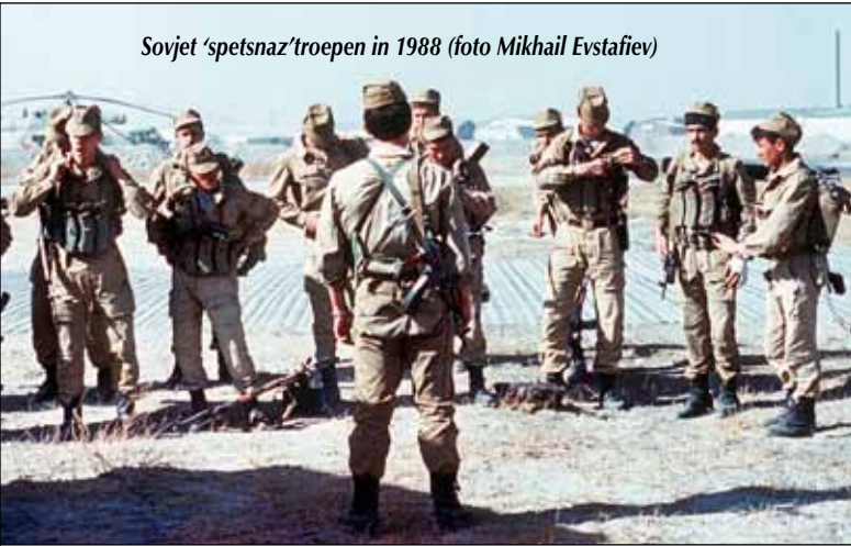
Sovjet 'spetsnaz'troepen in 1988

hulpverlening zoals deze vandaag gebeurt. Wel was de humanitaire crisis die het gevolg was van de verwoesting van de landbouw en van de vluchtelingenstromen veroorzaakt door de Sovjet-invasie een belangrijke factor voor de groei en legitimatie van Westerse en islamitische hulporganisaties.