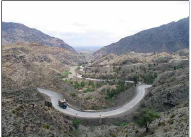
Belangrijke handelsroute: de Khyberpas, gezien vanuit Afghanistan

De Amerikaanse onderminister van Buitenlandse Zaken William J. Burns verwees in zijn steunverklaring aan de Istanboel-conferentie en haar eindtekst naar de New Silk Road -bijeenkomst die op 22 september plaatsvond in New York. Initiatiefnemers Afghanistan, de Verenigde Staten en Duitsland beklemtoonden op die bijeenkomst dat de politieke toekomst van Afghanistan in grote mate afhankelijk is van zijn economische toekomst – en die zou best de vorm krijgen van een nieuwe Zijderoute, een handelsknooppunt tussen het Midden-Oosten en het Verre Oosten, tussen Centraal-Azië en Zuid-Azië.