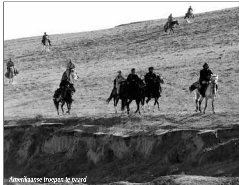
Amerikaanse troepen te paard

In 1977-1978, tijdens de Ethiopisch-Somalische oorlog in de Oga-den, organiseerde de Sovjet-Unie, in samenwerking met Cuba en Zuid-Jemen een succesvolle luchtbrug. Ongeveer 1500 militaire adviseurs werden gezonden om het Sovjet-geallieerde Ethiopische regime te steunen. Van zijn kant was de VS als enige supermacht uit de Koude Oorlog gekomen. In 1991 werd een makkelijke militaire