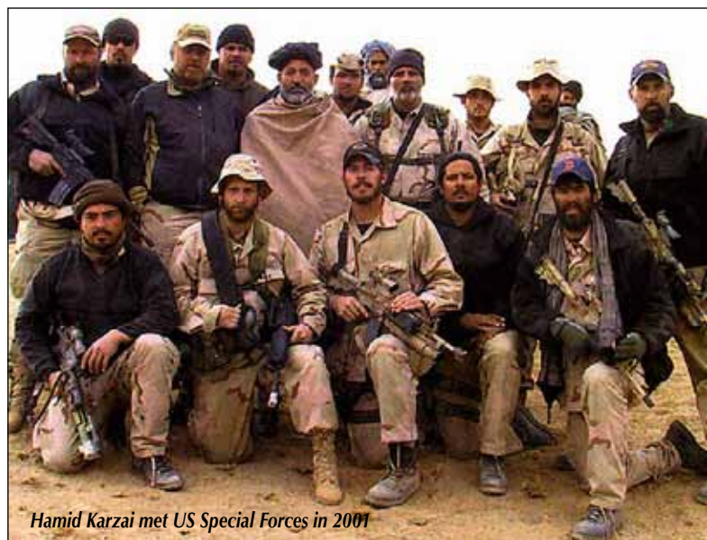
Hamid Karzai met US Special Forces in 2001

De Taliban en aanverwante groeperingen die zich verzetten tegen de Verenigde Staten en de ISAF genieten niet hetzelfde aura als "vrijheidstrijders" zoals de Moedjahedien die vochten tegen de Sovjets en het socialistische regime. Deze Moedjahedien verloren trouwens een groot deel van hun krediet toen ze na de Sovjet-uittocht begin 1989 leken te ontaarden in krijgsheren en bendeleiders. Toch is er binnen islamistische kringen weer een tendens om Afghanistan te beschouwen als een symbolische frontlijn; een belegerd, binnengevallen en bezet deel van de Dar Al-Islam, dat zich verzet tegen Westerse kruisvaarders, net zoals het zich verzette tegen de