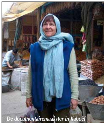
De documentairemaakster in Kaboel