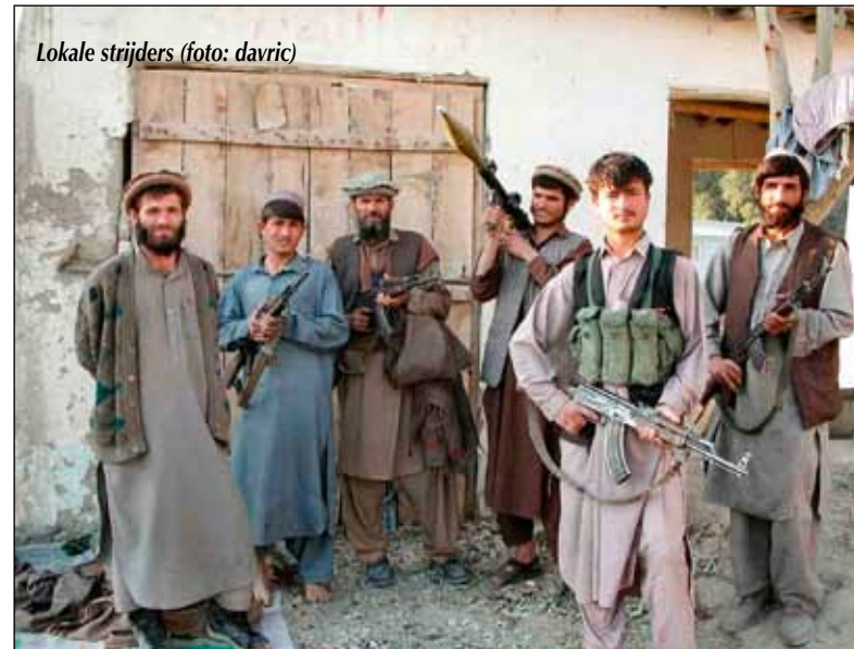
Lokale strijders

Vredesonderhandelingen moeten binnen een breed regionaal kader gebeuren, waarbij alle buurlanden betrokken zijn, bij voorkeur on-