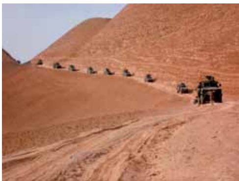
Coverfoto: Afghaans legerkonvooi bij de inzet van een nieuw bataljon