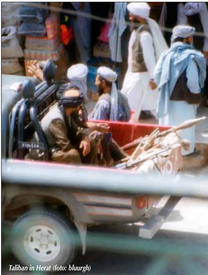
Taliban in Herat

De originele, Engelstalige versie van dit artikel "Parallel Frontlines: ten years of Soviet and American occupation compared" verscheen op de website www.opendemocracy.net