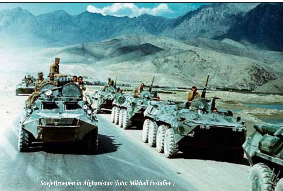
Sovjetroepen in Afghanistan

Het doel van de Sovjet-invasie was de bescherming en versterking van een al aan de gang zijnd project van natieopbouw. De machtsbasis van het socialistische Afghaanse regime beperkte zich echter tot bepaalde stedelijke groepen, een deel van de sjiitische minderheid en een aantal eenheden van de krijgsmacht. De dominante Russische invloed en de autoritaire wijze waarop het socialistische regime en de partijorganen landher-