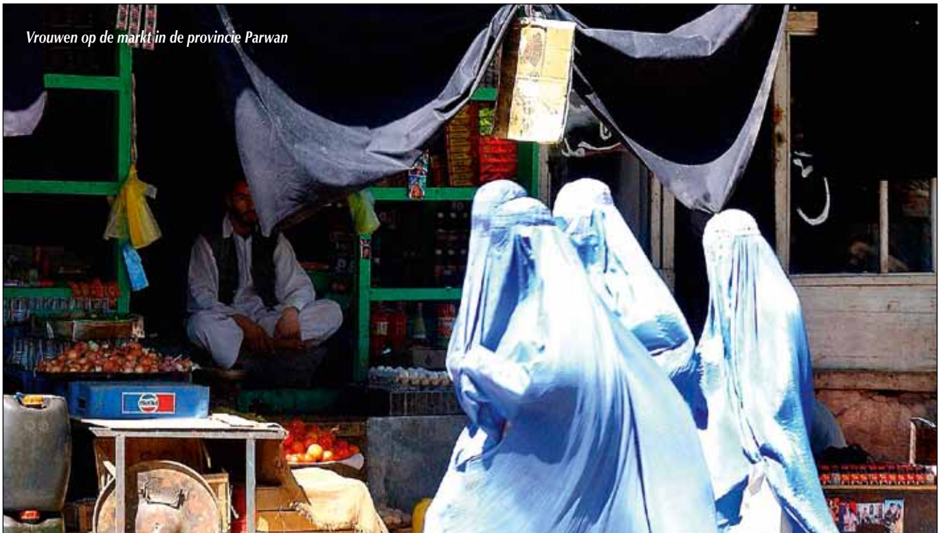
Vrouwen op de markt in de provincie Parwan

stand binnen de zender. Hij werd verdacht van financieel gesjoemel, al vermoedt de vredeswerkster dat dat dan weer een voorwendsel was om makkelijk van hem af te komen. Roshan had gewoon teveel oudgediende, conservatieve medewerkers voor het hoofd gestoten. Daarna werd het ook de Duitse duidelijk dat er weer een oude wind door het televisielandschap ging waaien. Plots wilde geen enkele vrouw nog meewerken aan de modeprogramma's. "In Afghanistan zegt niemand rechtuit wat er mis is", zegt de filmmaakster. "Pas toen de mode-uitzendingen waren stopgezet, merkte ik dat de vrouwen elkaar niet meer vertrouwden. In het jongerenprogramma durfden mannen en vrouwen niet meer samen debatteren. Mannelijke presentatoren durfden alleen nog mannen interviewen. De behoudsgezinde werknemers vonden nieuwe adem en sloegen terug".